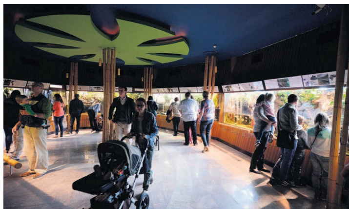
► Przy akwarium od niedawna działa Fundacja Rozwoju Akwarium Gdynińskiego. Członkom udało się już uzyskać ponad 60 tys. złotych dotacji na remont tarasu wraz z podporami i balustradą budynku

EGuide'y trafiły do akwarium dzięki projektowi BalticMuseums 2.0 Plus. ●