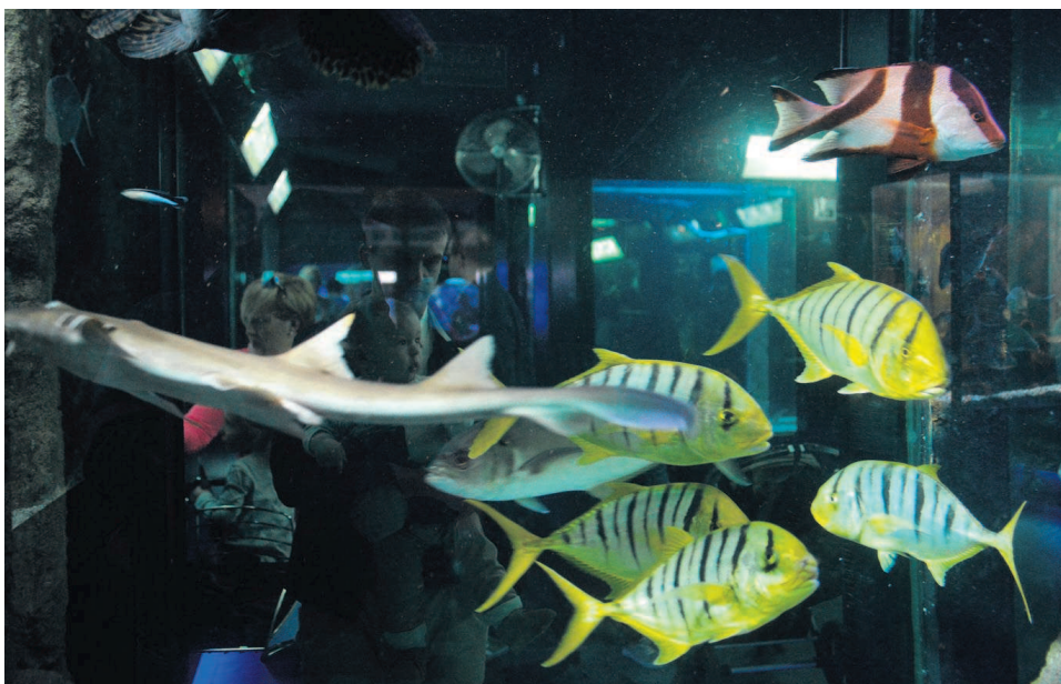
► Akwarium Gdynińskie, poza tradycyjnym zwiedzaniem, oferuje również specjalnie przygotowane zajęcia z edukacji morskiej. Uczestnicy mogą wziąć udział m.in. w pokazach laboratoryjnych. Placówka proponuje także specjalne atrakcje, m.in. podczas ferii zimowych i wakacji

Akwarium Gdynińskie można zwiedzać samodzielnie, z przyrodnikiem lub z... Krystyna